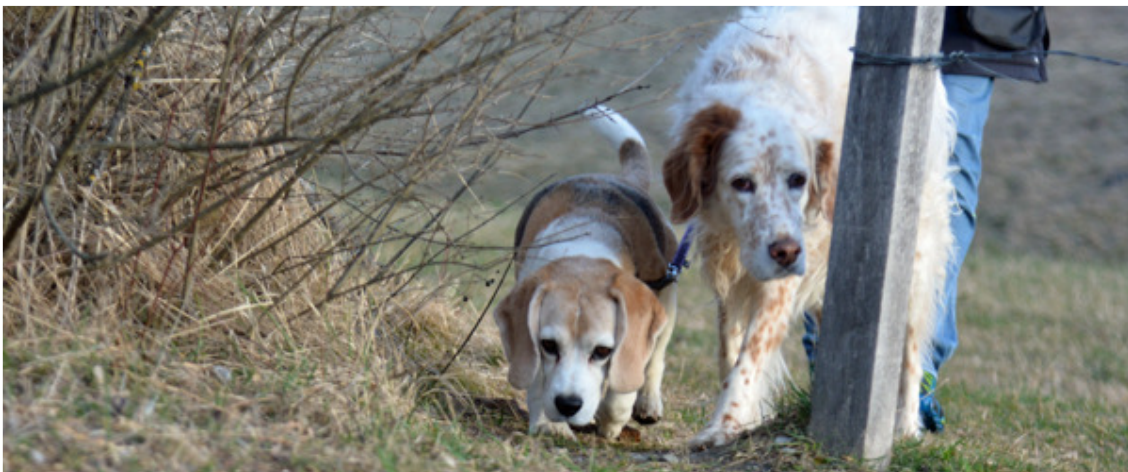
Gin und Fissa

Freude herrscht! Jedes Mal, wenn ich das Gelände des dogshome betrete, freue ich mich. Ich freue mich auf die Hunde, die da sind. Dass diese Freude gegenseitig ist, berührt mich besonders. Es ist ein grosses Geschenk, mit einer Fellnase Zeit verbringen zu dürfen, sei es auf einer unserer Wiesen oder auf einer gemeinsamen Entdeckungstour 😊. Jede gemeinsame Aktivität ist gleichzeitig auch eine Lernerfahrung für mich. Denn: Kein Hund ist wie ein anderer. Alle sind so einzigartig in ihrer Art und ihrem Ausdrucksverhalten.