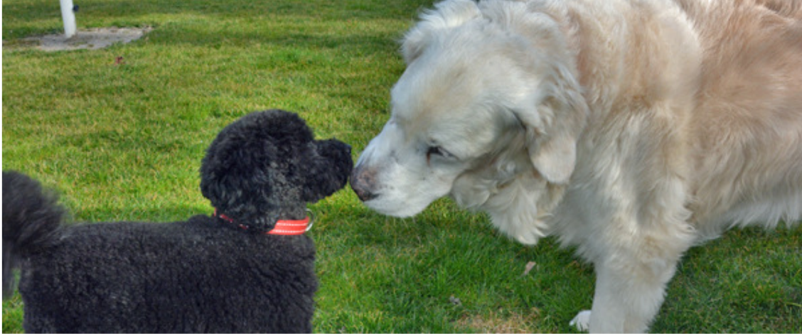
Niro und Ninja