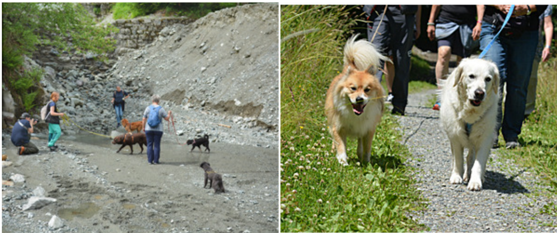
Die Zwei- und Vierbeiner geniessen die Zeit im Montafon.

Wisst ihr, wer uneinholbar an der Spitze der Liste der Teilnahmen steht? Meine Sanaya. Sie wird zum 42. Mal mit mir und uns ins Montafon reisen. Zum ersten Mal kam sie 2008 als kleines Hundebaby mit. Sie könnte ein Buch schreiben, was sie alles erlebt hat. Es würde mit Sicherheit ein Bestseller!