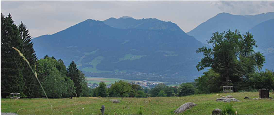
Sicht ins Churer Rheintal

Verhältnissen, dies durften wir auch in dieser fordernden COVID-Zeit erfahren. Happy birthday, liebe Schweiz! Du hast dich gut gehalten, für dein Alter 😊!