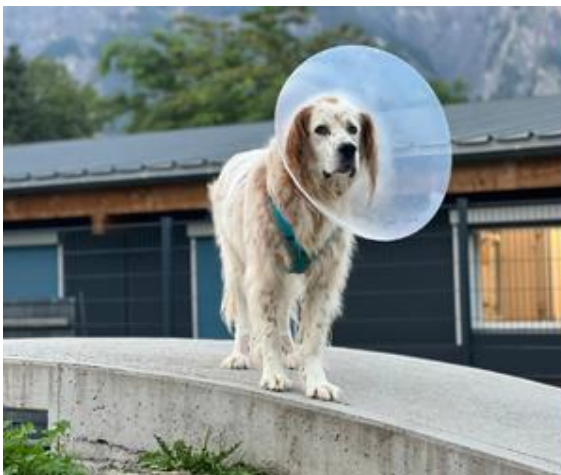
Kimon nach dem Tierarztbesuch

All dies geht nur dank eurer Unterstützung. Wir haben leider keine Notenpresse, die uns das Drucken der benötigten Gelder ermöglicht. Wir können nur darum bitten, dass ihr euch von dem, was ihr lest und hört berühren lässt und mit einer Spende dazu beiträgt, dass solche kleinen Wunder möglich werden.